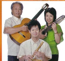
グルーポ・カンタティ