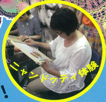
ギョンドゥティ体験